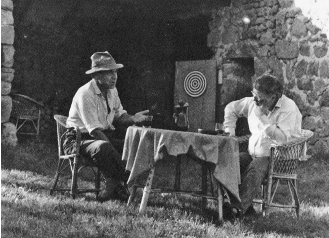
Lebovisi i Debor, Šampo (Champot), 1983.