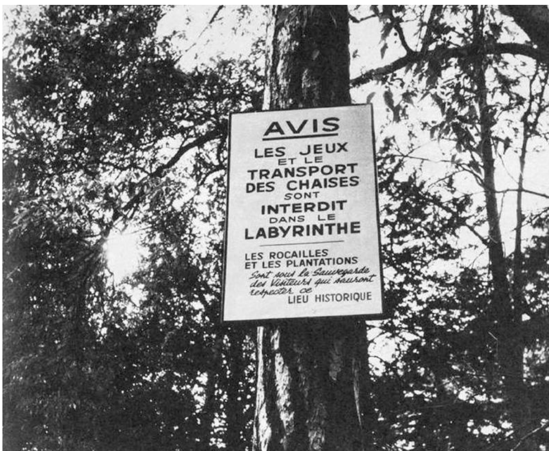
Natpis iz Botaničke bašte (Jardin des plantes), preuzeto iz Situationist Times (Jacqueline de Jong), br. 4, oktobar 1963, str. 73.