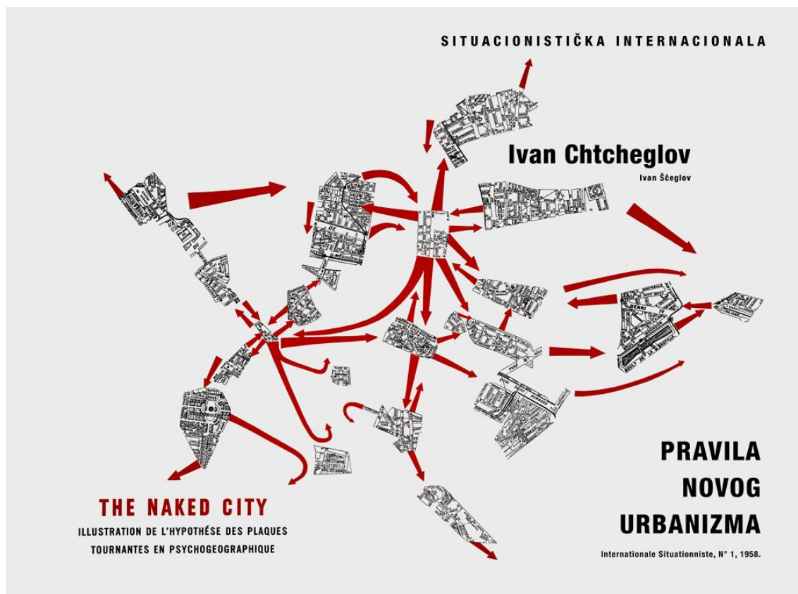
Buklet anarhije/ blok 45, 20 str., 13,5 x 20 cm. Na koricama: Guy-Ernest Debord, „Goli grad: Ilustracija hipoteze o čvorištima u psihogeografiji“, 1957.