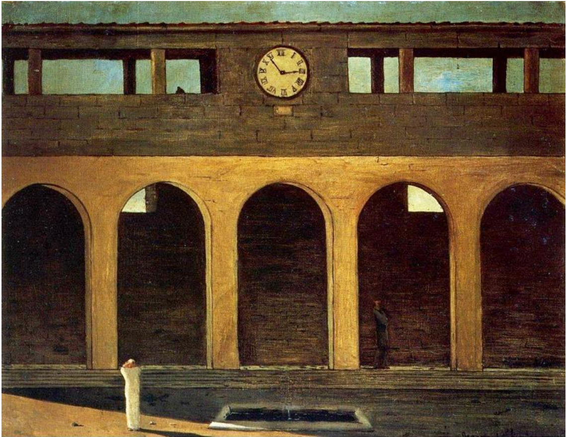
Giorgio de Chirico, „Enigma sata”, 1910. ili 1911.