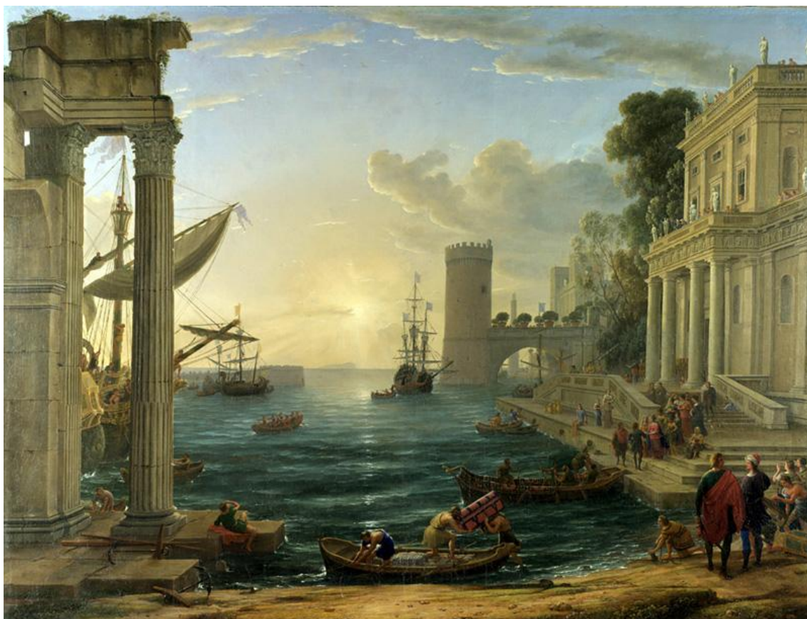
Claude Lorrain, „Ukrčavanje kraljice od Sabe“, 1648.