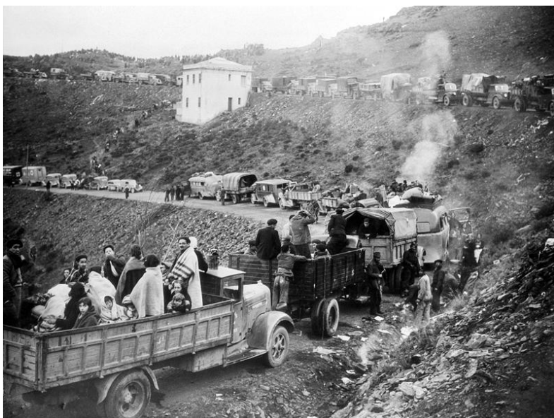
Portbou 1936. i 1939.