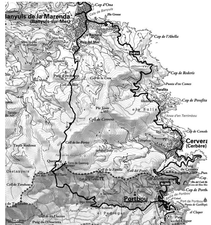
„Ruta/ Chemin Walter Benjamin“: na mapi, linija u dubini kopna.

https://www.chicagoreader.com/chicago/a-woman-in-the-resistance/Content?oid=873867