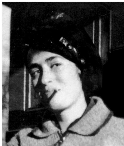
Poslednja fotografija Valtera Benjamina, 1940. Liza Fitko, Berlin, 1928.