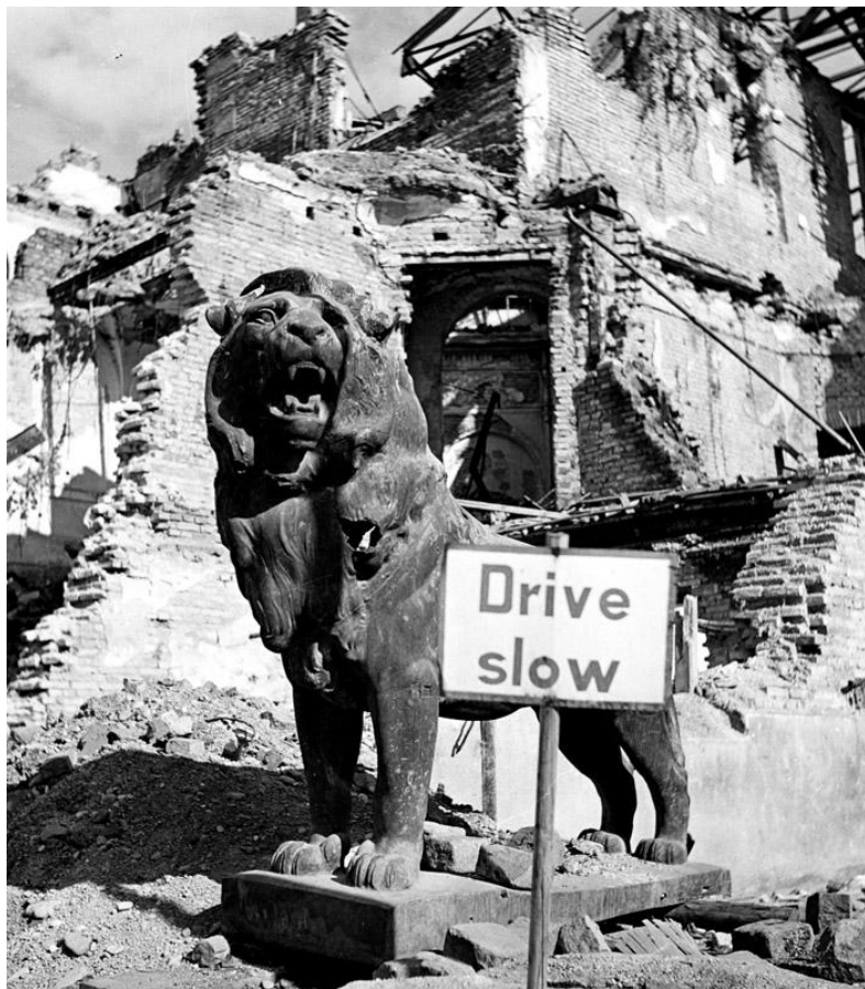
Herbert List, Minhen, 1946.