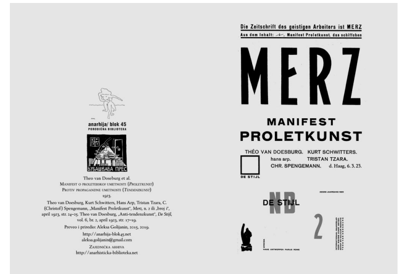
Buklet anarhije/ blok 45, 16 str.