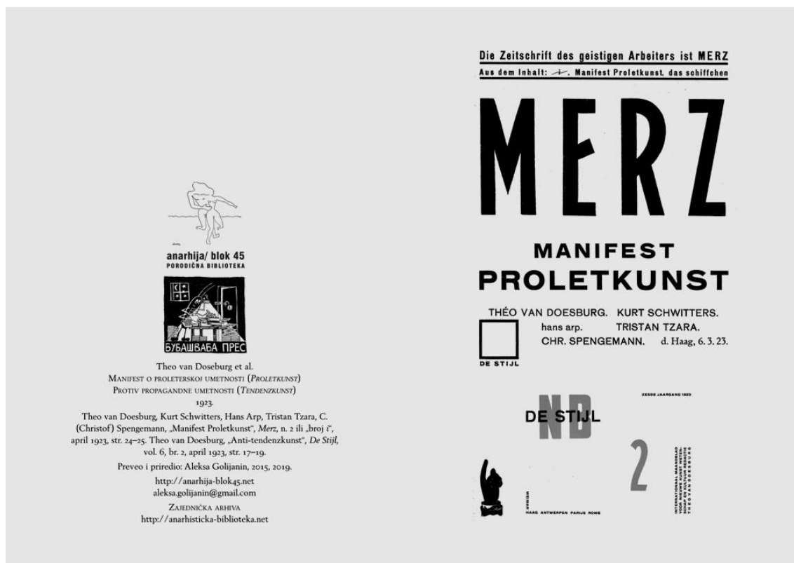
Buklet anarhije/ blok 45, 16 str.