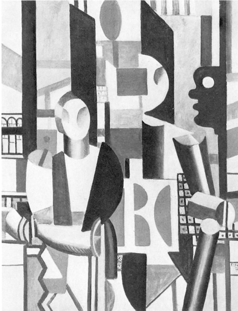
Segmentacje (zespół typów)

Segmentowanie dokonuje się zewsząd i w każdym kierunku. Człowiek to zwierzę segmentowe. Segmentacja jest własnością wszystkich warstw, które