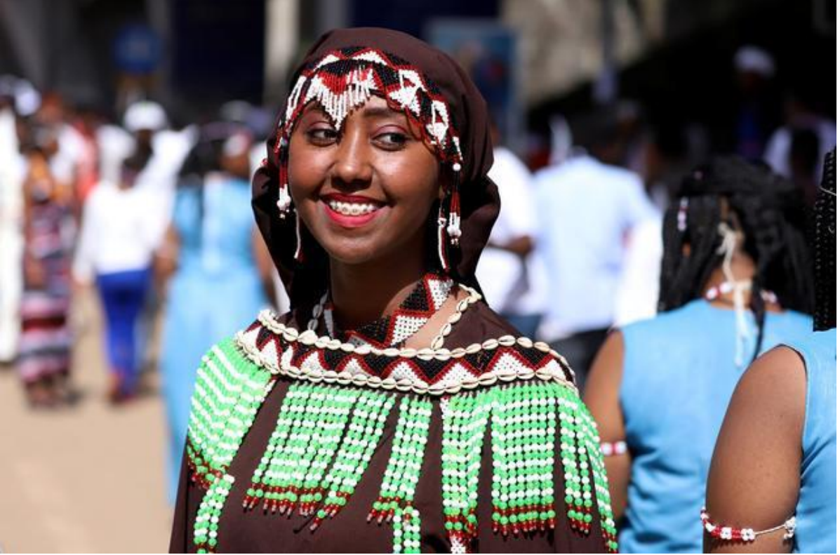
Geleneksel elbiselerle süslenmiş bir Oromo kadın.