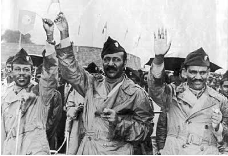
Derg hükümet görevlileri resmi üniformalarıyla.