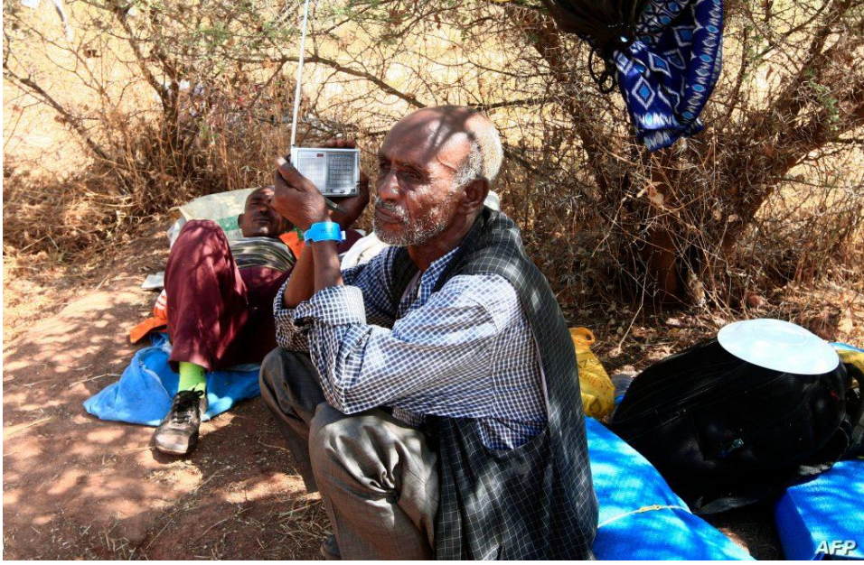
Tigraylı bir adam elinde küçük taşınabilir radyo tutuyor, bilgi kirliliğine rağmen haberleri duymaya çalışıyor.