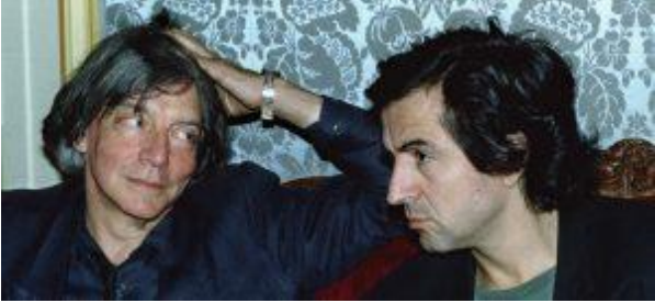
André Glucksmann (solda) ve Bernard-Henri Lévy

durumu mükemmel bir şekilde özetliyordu: “1954’te Guatamala’ya, 1965’te Dominik Cumhuriyeti’ne, 1973’te Şili’ye, 1980’lerde El Salvador ve Nikaragua’ya felaket getiren ve birçok insanın canına mal olan müdahalelerinin dışında, ABD sessiz ama istikrarlı bir biçimde katil terör devletlerine ayaklanmaları bastırmaları için finansal, aynı ve ahlakî yardımlarda bulundu. Ancak Stalin’in işlediği suçların boyutu; -ne kadar ikna edici, delillere dayalı da olsa- kirli hikâyelerin bugün demokrasi olarak bildiğimiz şeyi savunmada ABD’nin oynadığı örnek role dayanan dünya görüşünün temellerini sarsmasını engelliyordu.”