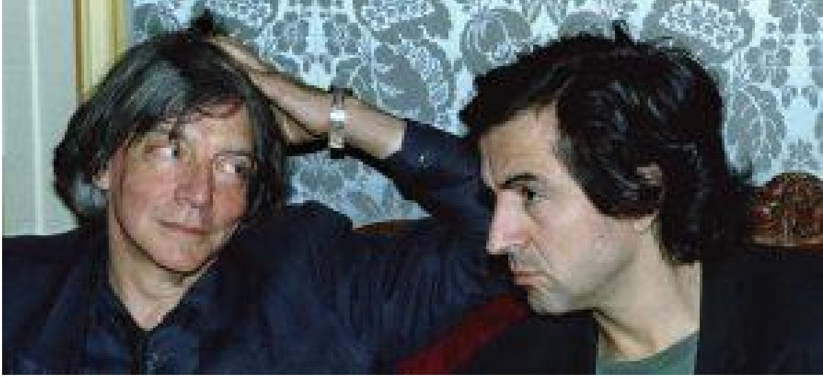
André Glucksmann (solda) ve Bernard-Henri Lévy

1980'lerde El Salvador ve Nikaragua'ya felaket getiren ve birçok insanın canına mal olan müdahalelerin dışında, ABD sessiz ama istikrarlı bir biçimde katil terör devletlerine ayaklanmaları bastırmaları için finansal, aynı ve ahlakî yardımlarda bulundu. Ancak Stalin'in işlediği suçların boyutu; -ne kadar ikna edici, delillere dayalı da olsa- kirlî hikâyelerin bugün demokrasi olarak bildiğimiz şeyi savunmada ABD'nin oynadığı örnek role dayanan dünya görüşünün temellerini sarsmasını engelliyordu.”